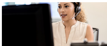
Agents de centre d'appel