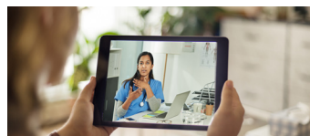
Professionnels de la télémédecine